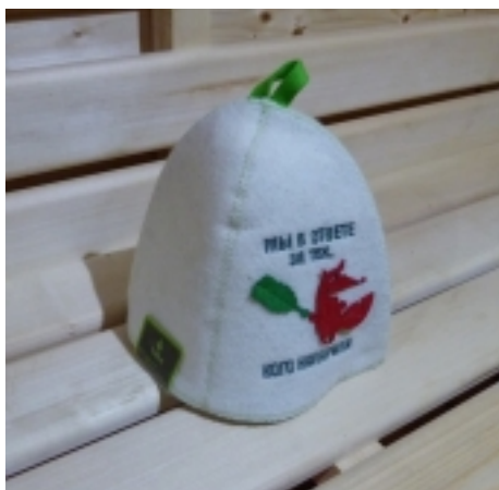
Ďiapka do sauny 11,88 €

Ďiapka do sauny -vyrobená zo 100% ovčej vlny -zabraňuje prehrievaniu pokožky hlavy -zabraňuje ničeniu vlasov -väčšorborne absorbuje vlhkosť -vlákná sú antialergická -použitá materiál je úplne recyklovateľný a neškodí životnému prostrediu [Detaily tovaru...]