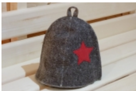
Ďiapka do sauny. 9,90 €

Ďiapka do sauny-detská -vyrobená z 100% ovčej vlny -zabraňuje prehrievaniu pokožky hlavy -zabraňuje ničeniu vlasov -väborne absorbuje vlhkosť -vlákná s antialergickými -použitými materiálmi je úplne recyklovateľná a nenákladným prostredím Pri saun [Detaily tovaru...]