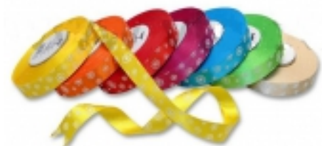
Atlasová stuha s potlačou 15mm 0,40 €

Mákká a tvarovo stáje poloperliky zaručia protiľmykovú ochranu nie len ponožkám. [Detaily tovaru...]