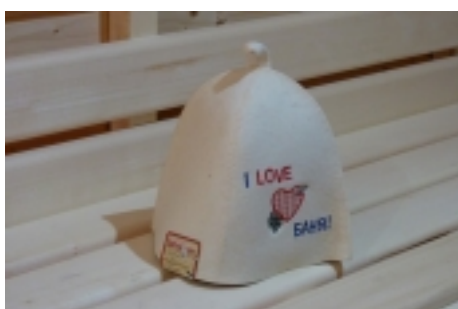
Ďiapka do sauny 9,90 €

Ďiapka do sauny -vyrobená zo 100% ovčej vlny -zabraňuje prehrievaniu pokožky hlavy -zabraňuje ničeniu vlasov -väčšorborne absorbuje vlhkosť -vlákná sú antialergická -použitá materiál je úplne recyklovateľný a neškodí životnému prostrediu [Detaily tovaru...]