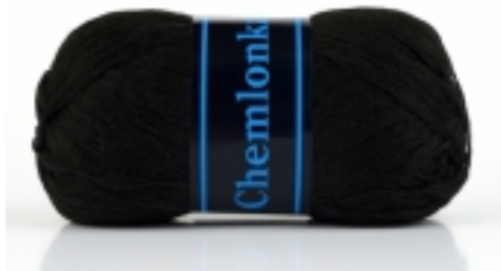
Chemlonka 0,80 €

Veľmi kvalitná ručná pletacia bavlnená priadza, klbko 50g = 125m, odporúčaná hrúbka ihlíc 2,5 - 3,5 mm. Ďeská v 1/2 robok, vyrobená exkluzívne pre VTC, a.s., vlastnosti totožné s priadzou Camilla. [Detaily tovaru...]