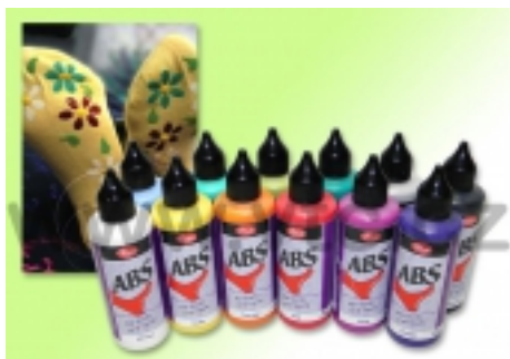
ABS protiľmyk 82ml. 6,20 €

Mákká a tvarovo stáje poloperliky zaručia protiľmykovú ochranu nie len ponožkám. [Detaily tovaru...]