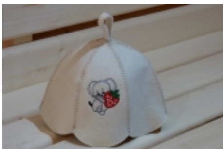
Ďiapka do sauny 9,90 €

Ďiapka do sauny -vyrobená z 100% ovčej vlny -zabraňuje prehrievaniu pokožky hlavy -zabraňuje ničeniu vlasov -väborne absorbuje vlhkosť -vlákná s antialergickými -použitými materiálmi je úplne recyklovateľná a nenákladným prostredím [Detaily tovaru...]