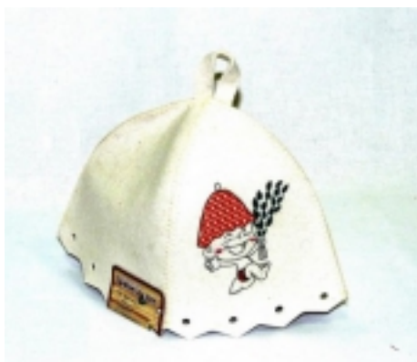
Ďiapka do sauny-chlapčiek 9,90 €

Ďiapka do sauny-detská -vyrobená z 100% ovčej vlny -zabraňuje prehrievaniu pokožky hlavy -zabraňuje ničeniu vlasov -väborne absorbuje vlhkosť -vlákná s antialergickými -použitými materiálmi je úplne recyklovateľná a nenákladným prostredím [Detaily tovaru...]