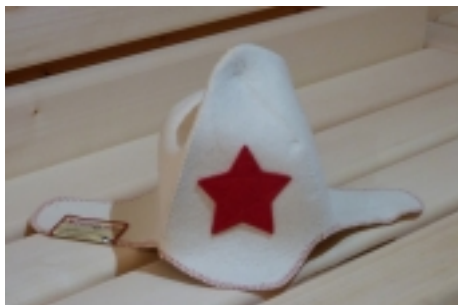
Ďiapka do sauny. 9,90 €

Ďiapka do sauny -vyrobená zo 100% ovčej vlny -zabraňuje prehrievaniu pokožky hlavy -zabraňuje ničeniu vlasov -väborne absorbuje vlhkosť -vlákná s° antialergická -použitá materiál je 0plne recyklovateľný a neničivotné prostredie [Detaily tovaru...]